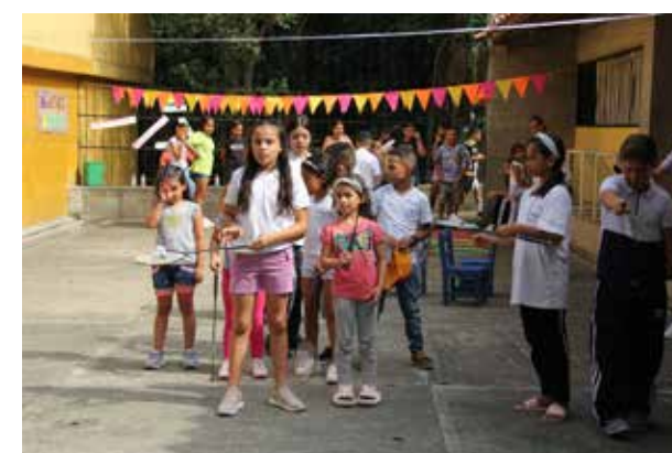
Laboratorio lúdico Bolombolo