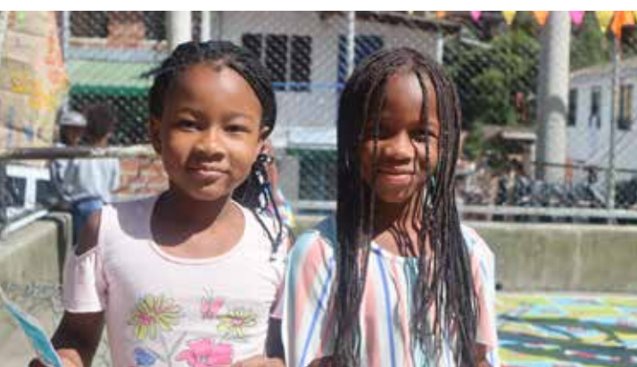
Laboratorio lúdico comuna 8