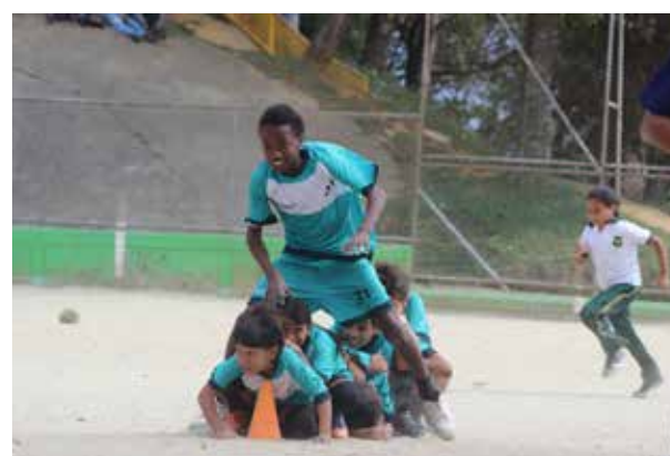
Goles de Paz San Blas