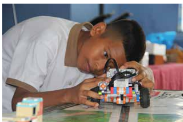
Inspiración Comfama El Bagre