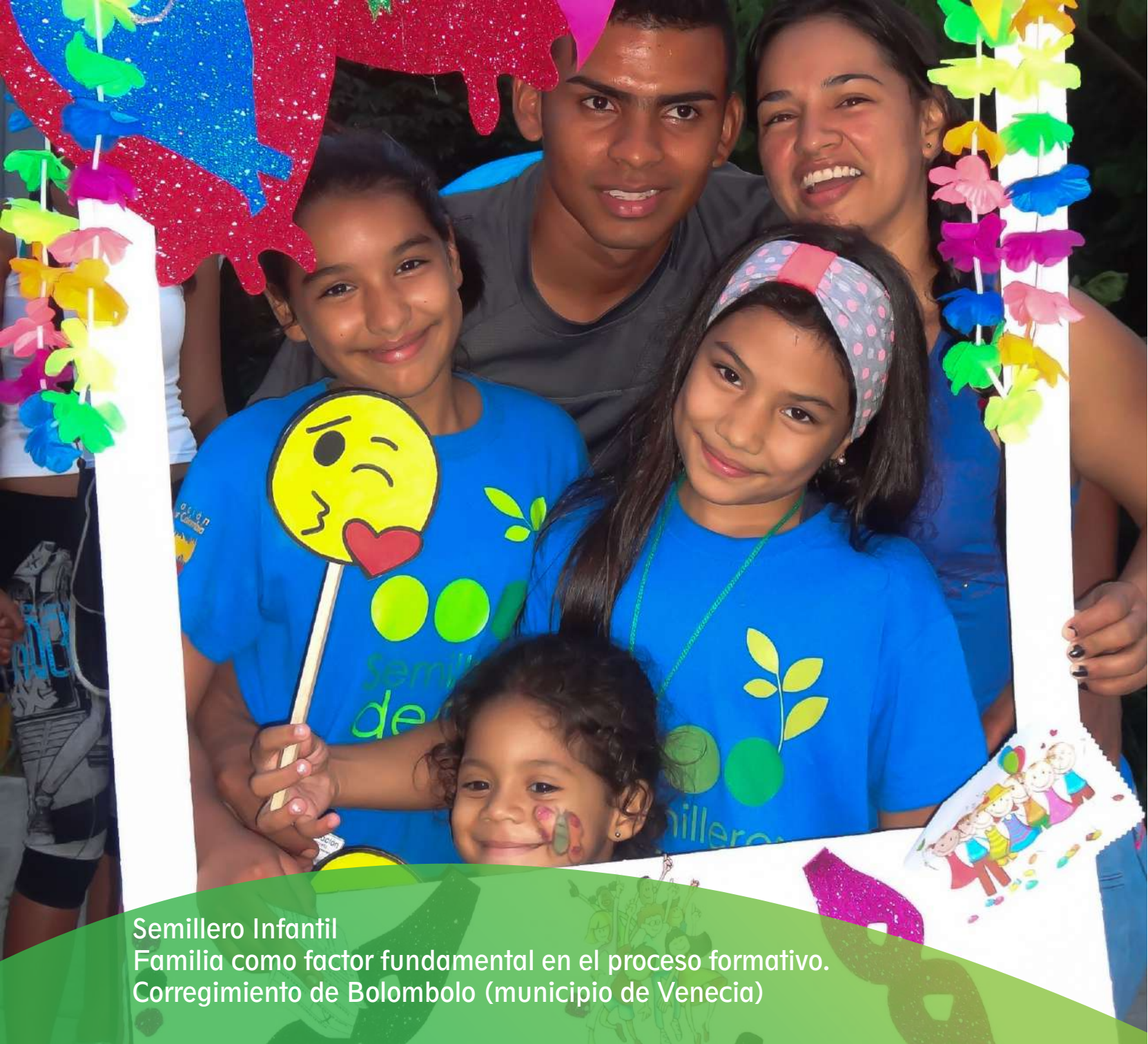
Semillero Infantil Familia como factor fundamental en el proceso formativo. Corregimiento de Bolombolo (municipio de Venecia)