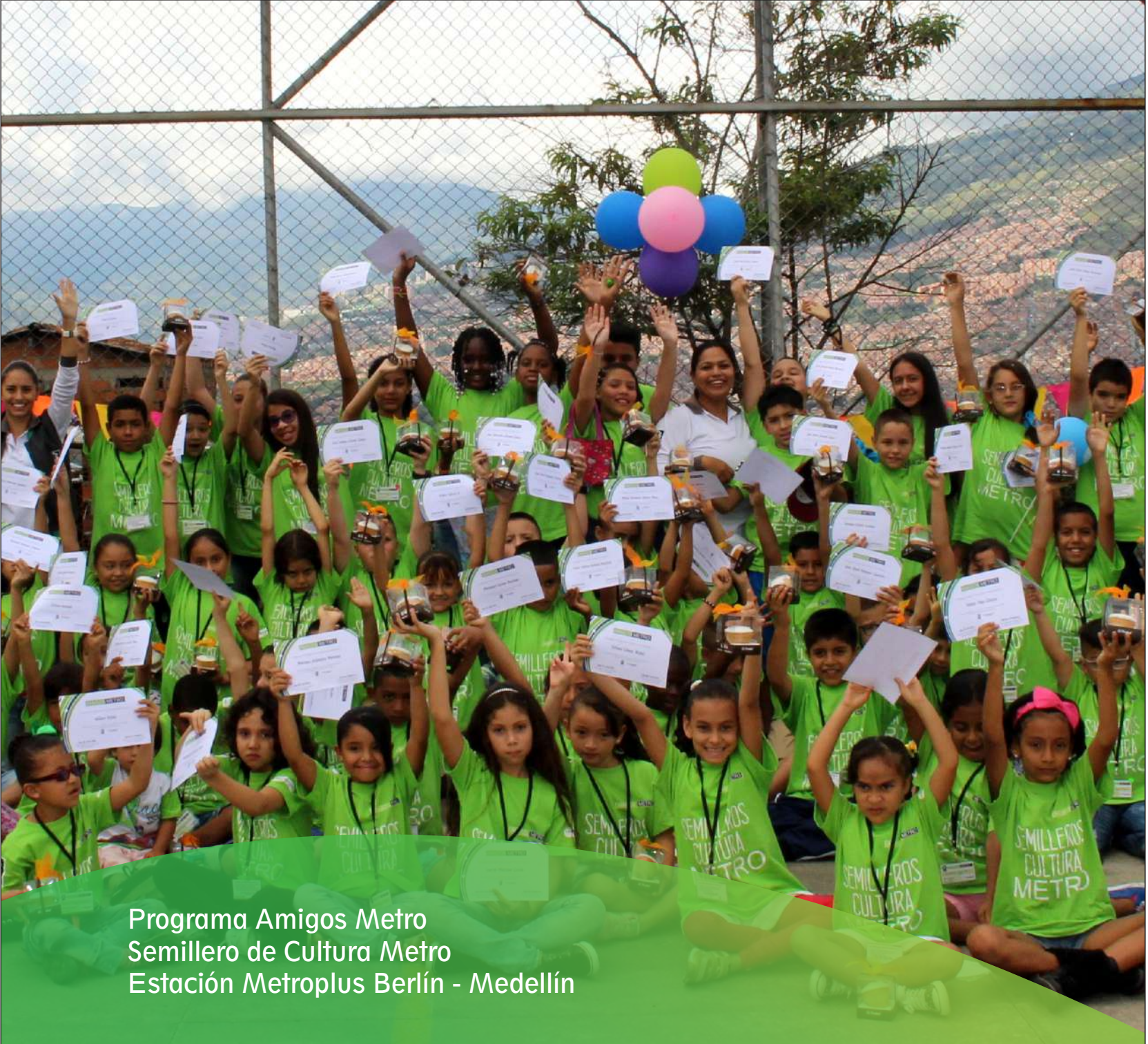
Programa Amigos Metro Semillero de Cultura Metro Estación Metroplus Berlín - Medellín